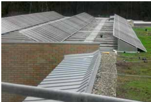
Ein zukunftsweisendes Projekt, das durch das Engagement des Vereins und vieler Spender realisiert werden konnte, war die Errichtung einer Photovoltaikanlage auf dem Ostflügel unseres Gymnasiums.

Beitrittsformulare erhalten Sie im Schulsekretariat und unter der Adresse des Fördervereins.